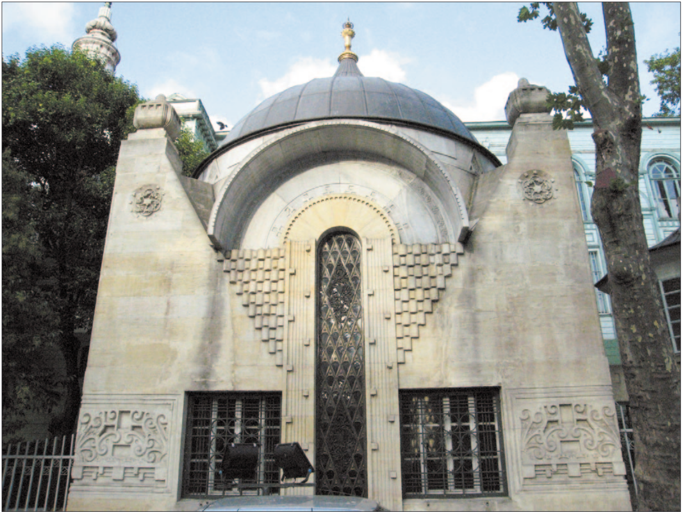
Tomba dello Sceicco Zafir Effendi.