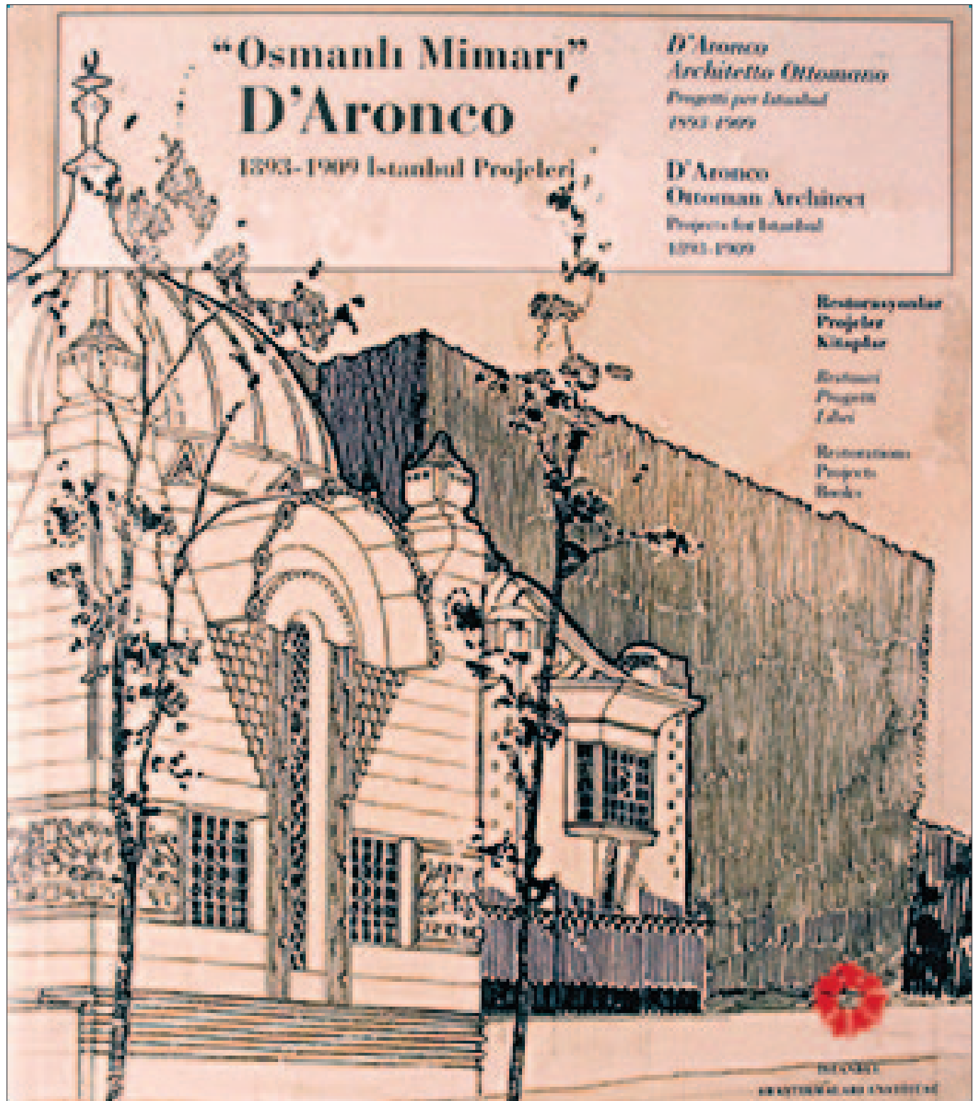
Architetto D’Aronco. Progettista delle Villa Tarabya.